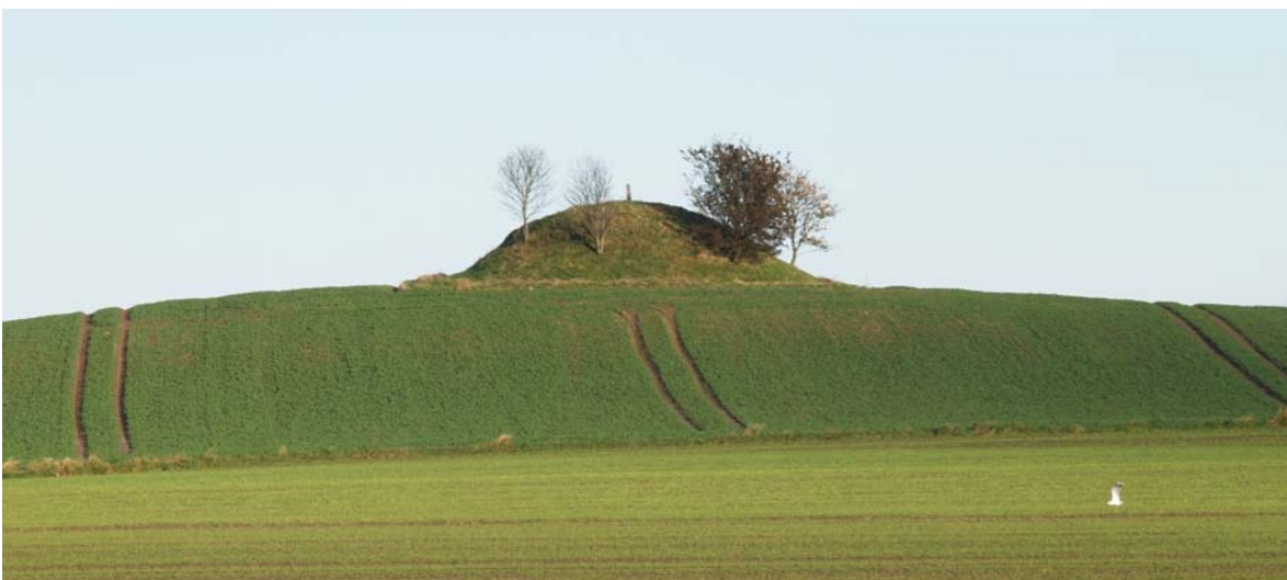
Både fra Holbæk Landevej og vejen mellem Vester Såby og Sonnerup ses Tjørnehøj tydeligt som den ligger højt på bakken.