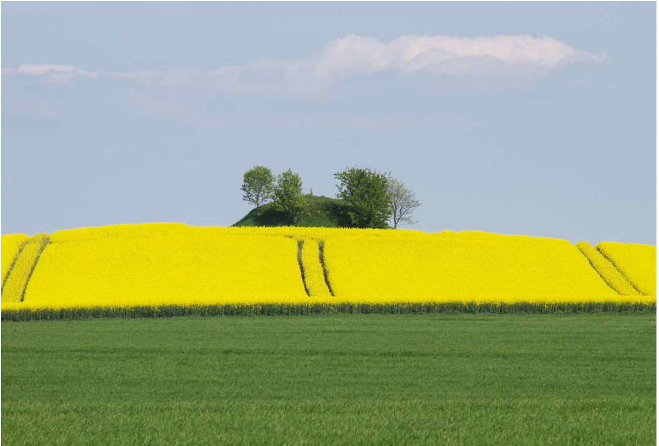
Flot, velformet gravhøj fra bronzealderen 1.400 f. Kr. 15 x 15 x 3 m.

Fredningsnummer 322543 Sognebeskrivelse 020607-30